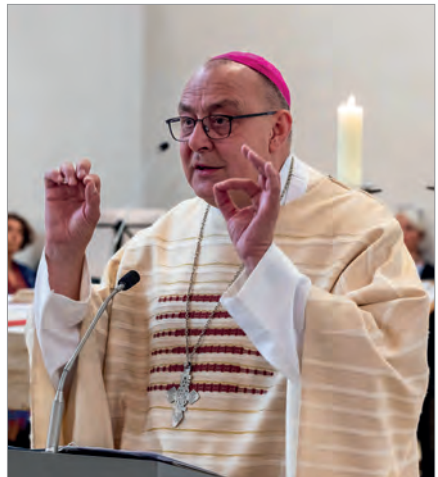
Wort- und gestenreich gestaltete Bischof Dominicus den Gottesdienst in unserer Gemeinde.