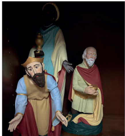
Auch im Jahr 2025 feierten wir am Heiligen Abend die Christmette um 17 Uhr. Die große Zahl an Gottesdienstbesuchern zeigte, dass diese Uhrzeit von vielen Gemeindemitgliedern angenommen wird