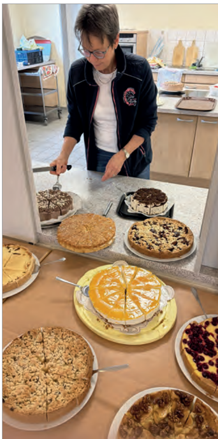
Dank vieler fleißiger Hände war auch für das leibliche Wohl gesorgt: reichlich Kaffee und Kuchen schafften eine gute Grundlage für die Gemeindeversammlung

Nach Berichten über die Neuausrichtung des „Forum Osnabrück – Kleine