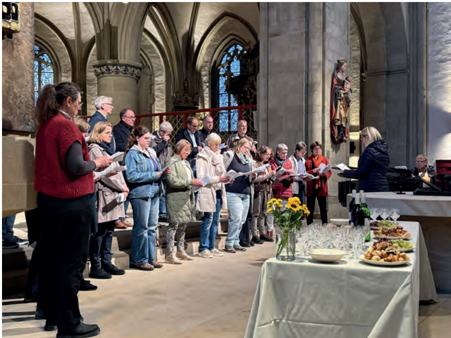
Die Sängerinnen und Sänger der Schola sorgten beim Feiern für den guten Ton