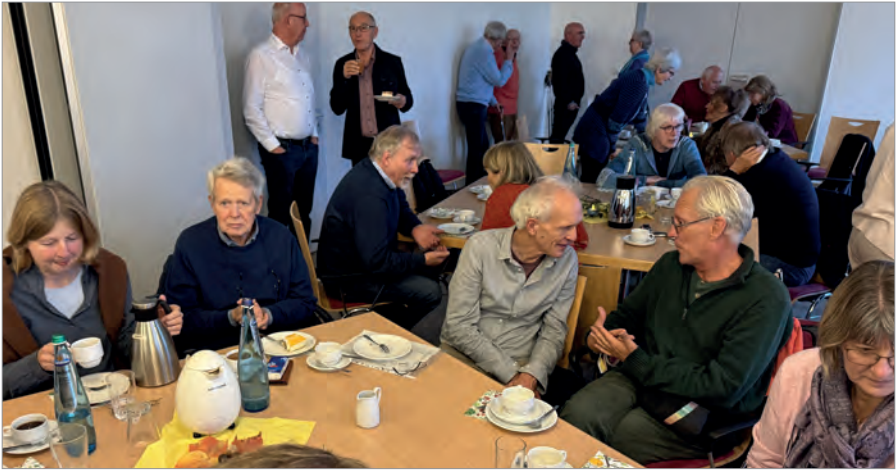
Neben dem offiziellen Teil blieb genug Zeit für Begegnung und Gespräch der Gemeindemitglieder

che“ und eine Übergangsregelung für die Wahlen zum Leitungsteam.