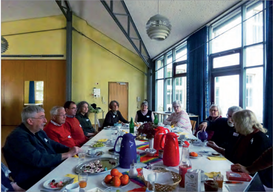
Alle, die an der Vorbereitung der Friedensgebete beteiligt sind, trafen sich zu Brunch und Gedankenaustausch im Gemeindesaal von St. Marien

An jedem Samstagmittag treffen sich Christen aus der Stadt um 11:30 Uhr zu einem 20-minütigen Friedensgebet in St. Marien. Die Teilnehmerzahl wechselt zwischen ca. 15 und 50.