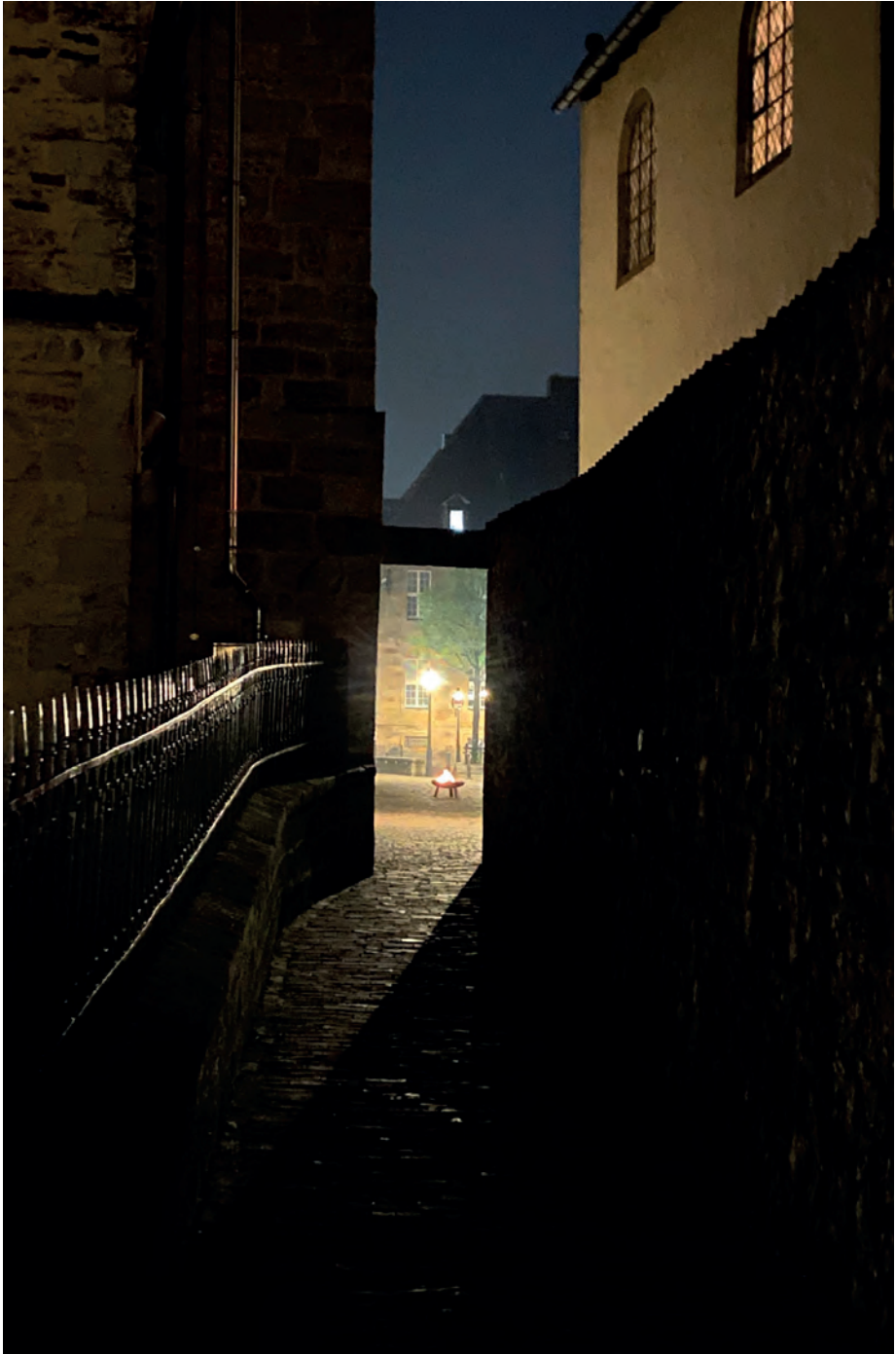
Östermorgen 2025